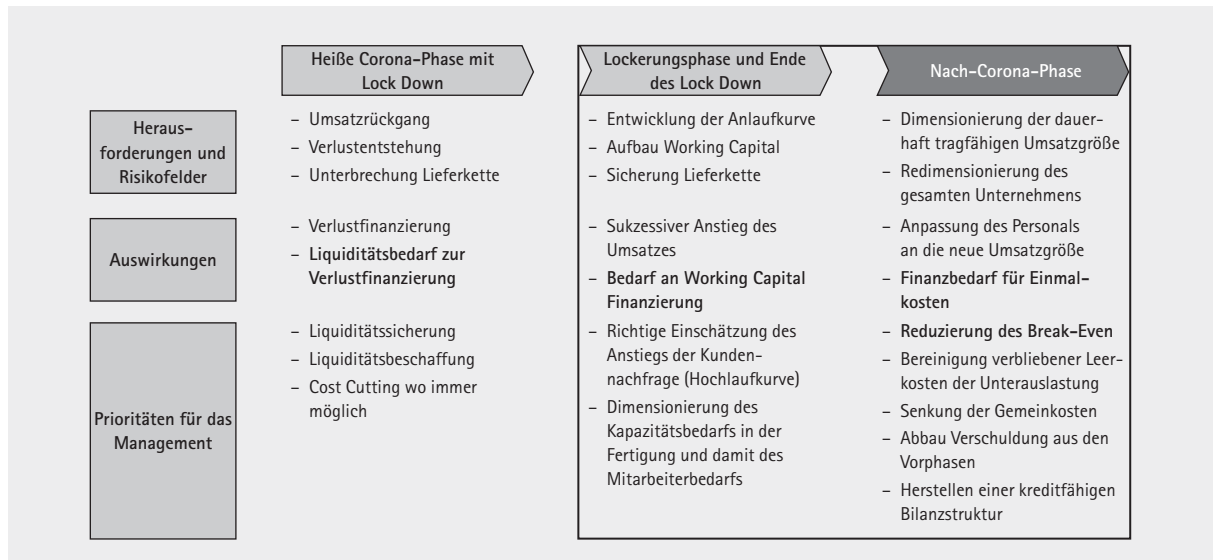
Abb. 1: Die Phasen der Corona-Krise und ihre Herausforderungen

Robustheit beinhaltet oder dokumentiert die Fähigkeit des Unternehmens, auf Risiken an- gemessen zu reagieren.