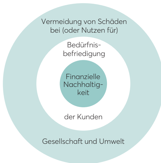
Abbildung 1: Eigenschaften nachhaltiger Unternehmen